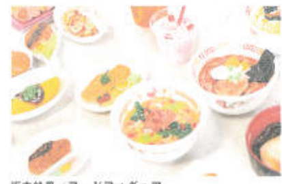
坂本絵里 / フードフィギュア